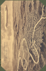
Mittellicher Rheingau bei Koblenz über Jura