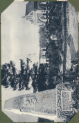
Brüssel La Bourse