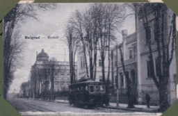
Belgrad — Knež