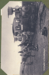
Feldbahn in Feindesland.