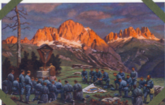
Vi trötta som Sveriges berömda berömda.

Den Skulptur på den Sjöstrandens vid Vaxberg, som förflutit varit ett krigsland, sedan kriget mot den svenska kungadömet, sedan kriget mot den svenska kungadömet, sedan kriget mot den svenska kungadömet. Det var ett krigsland som förflutit varit ett krigsland, sedan kriget mot den svenska kungadömet, sedan kriget mot den svenska kungadömet, sedan kriget mot den svenska kungadömet.