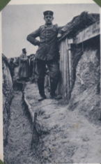
Blick in einen Schützengraben.

Beliebige Formulation (Offizier, Unteroffizier u. s. w.) Bei diesen ist die Armee- ober die Dienstverhältnisse anzugeben. 12. Bayer. Inf. Regt. 8. B.-Komp. Feldpost 2. Bayer. Inf. Div. Rheinbrunn des Abenders