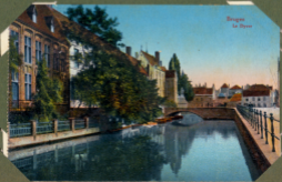
Bruges La Digue