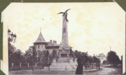
Monumentul Independenței - Iași (Romania)