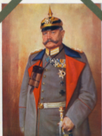
Franz Anton ... ...