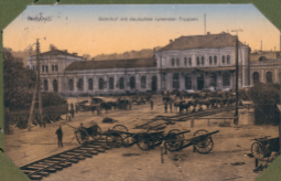
Bahnhof mit deutschen rufenden Truppen.