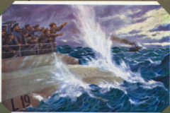
"Stephen" aber, du bist verflucht