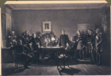
Kapitulation von Sedan.