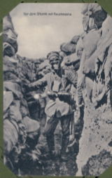
Vor dem Sturm mit Faustwaffe