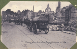
Einzug einer deutschen Bagagekolonne in Lille.