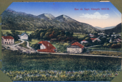
Bau der Sept. Hängele 1915/16.