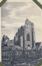
Lagebark A. Pion...