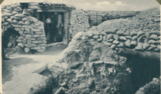
Eingang zu einem Minenstollen, umtriebene Steine bis an 1920, unter die sandichte Linien