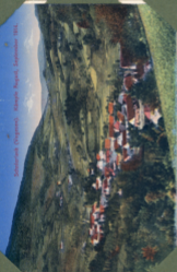
Edelkornau (Oxygeten) - Klängele Bergort, September 1914.