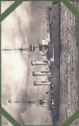
Der deutsche Schlachtschiff „Grosser Kurfürst“.