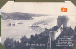
Der türkische Krieg

Im Jahre 1854 Krieger mit der Geschütze Die türkische Flotte versetzt und belagerte mehrere russische Schiffe