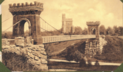
CRAIGVA Párcsi Tívesen, Podol Szendrőt