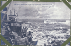
Die Deckung eines russischen Zerstörers und auf Jacht eines deutschen Dampfers über den Nordsee

Im Jahre 1854 Krieger mit der Geschütze Die türkische Flotte versetzt und belagerte mehrere russische Schiffe