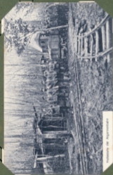
Habitacle des Agglomérés