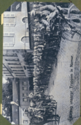
Einzug unserer Truppen in Namur.