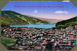
Görsdörf (Frax. Vagessen), nächste franz. Stadt bei Schlachtspitz.