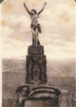
Kreuz von Seeburg.

Dies ist der Gedenkstein bei Seeburg i. Odenw. Gebirge. Er wurde im Jahr 1914 im Zuge der 12. Bayer. Inf. Div. errichtet. Der Stein ist im Besitz des Erbprinzen von Bayern.