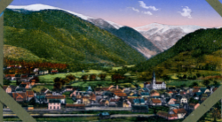
Melzer (Münstertal) mit Blick auf Hahnenk. Köpfe 1916/18.