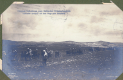
Original-Aufnahme von türkischen Kriegsschiffen. Türkische Artillerie auf dem Weg zum Frontland.