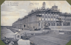
Замечательный Le palais d'Alex