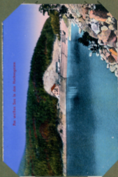
Der weiße See in den Hohenjungen