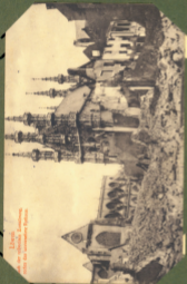
Übersicht auf die städtische Festung von der Festungsposition