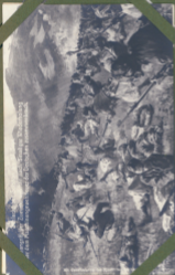
Leichte Gasmaske während der Wiederoberung von Le Mans am 8. Juli 1918.