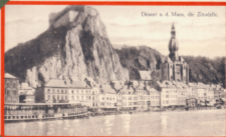
Desant a. d. Maas, die Zitadelle.