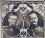
Die Bezwingler Rumäniens