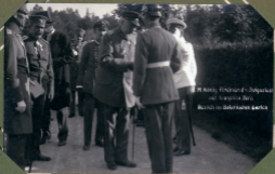
H. Knieb, Reichsminister für Volkskultur mit Frau und Kindern Besuch im Gefangenenlager