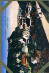
Pfirt (Sawilgan). Talsandstein und Schotter- aufschutt 1914/15.