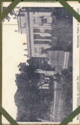
Warschau. Schloss im Łazienki Park. Warszawa, Pałac w Łazienkach.