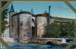
Bruges Porte de Gand