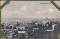
Totalansicht von Warschau