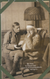
Der HIAS im September 1917 im Bureauplatz des Kriegsministeriums Hias - Württemberg.