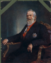
Prof. Dr. ...