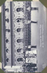
Ansprache der Kaiserin an den Reichstag.