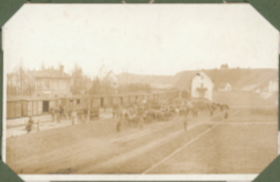
Stille von Truppen-Übungsplatz Lager Lechfeld Geschütz-Exerzieren