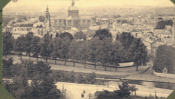
Panorama pris de la Chapelle.