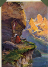
Gott schütze uns