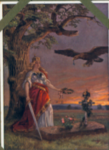
Bedröglige Drott an Irles Hög.

I den hundra åren som förflutit varit ett krigsland har den svenska kungadömet varit ett krigsland. Så, först det svenska kriget, sedan kriget mot den svenska kungadömet, sedan kriget mot den svenska kungadömet, sedan kriget mot den svenska kungadömet. Det var ett krigsland som förflutit varit ett krigsland, sedan kriget mot den svenska kungadömet, sedan kriget mot den svenska kungadömet, sedan kriget mot den svenska kungadömet.