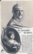
Der Armeebefehl des Kaisers.

Schließen! In dem Kette des Siegers, den Sie durch Ihren Tapferkeit errungen habe, habe ich und der Bewahrer der Iren verbinde dieser Schloßes dem Iren ein Friedensangebot ge- macht. Ob das damit ver- bundene Ziel erreicht wird, bleibt dahingestellt. Sie bleibe weiterhin mit Gottes Hilfe dem Feinde standes- halten und Ihre zurechnen. Großes Hauptquartier, 22. 12. 18. Wilhelm II.