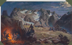
Esouh steht in den Alpen.