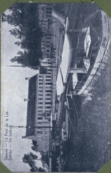
Devez — Le Pont de la Lys. Devez — De Lening