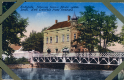
Xivlikide, Filibozog Ferenc Melder xivlikide Bruck. Hotel Erzherzog Franz Ferdinand.