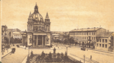
Warschau, Platz und Kirche des St. Alexander.