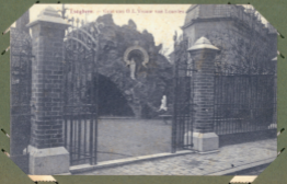
Entrée de la ville de Valenciennes