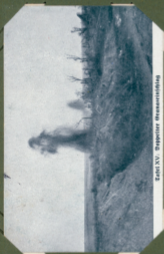
Zahl XV. Dampfwerk Orenburg.