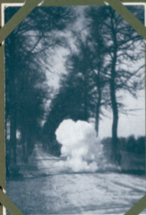
Tafel V: Ein Ruckenschieß