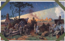
Belagerung von Kras.