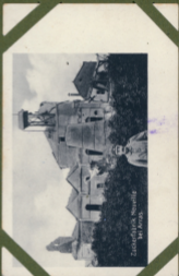
Zacareafacac Nouville 1911 A. 1905