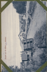
Stavila 1905 R. W. Thiel & Co. Bucharest