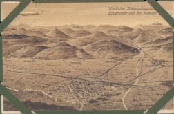
Würtlicher Kriegsarchiv Schlachtenfeld und die Vogesen