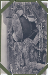
Original-Griffpatrone von Kruppgeschütz. Die Patrone ist von einem 42 cm Kaliber (16 Zoll) und ist ein Stück Photographieren des Original-Griffpatrone von Kruppgeschütz.