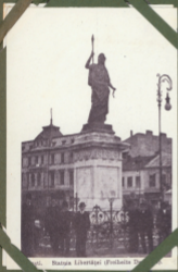
Statua Libertatis (Polonia)