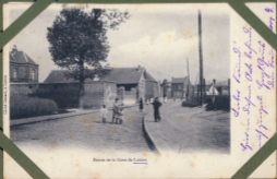
Rue de la Gare de Lohse

Statue Liberty in Lipson Old Lipson of Lipson Lipson Lipson