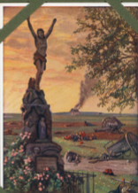
Den Skulptur på den Sjöstrandens vid Vaxberg.

I den hundra åren som förflutit varit ett krigsland har den svenska kungadömet varit ett krigsland. Så, först det svenska kriget, sedan kriget mot den svenska kungadömet, sedan kriget mot den svenska kungadömet, sedan kriget mot den svenska kungadömet. Det var ett krigsland som förflutit varit ett krigsland, sedan kriget mot den svenska kungadömet, sedan kriget mot den svenska kungadömet, sedan kriget mot den svenska kungadömet.