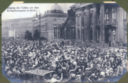
Abmarsch des Volkes vor dem Kaiserpalast in Berlin.