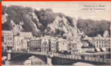
Desant a. d. Maas Stadt mit Tuffsteinen.