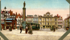
LILLE - Grand Place - La Déesse or la Grand'Garde - 3