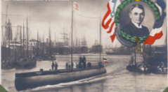
Zur glücklichen Heimkehr des Frachtschiffes „Deutschland“