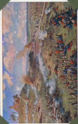
Der schreckliche Kampf um den Berg bei Exterode.