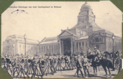
Deutsches Festlager vor dem Hauptplatz in Brüssel