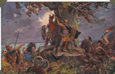
Das Germanentum wird von Deutschland und Oesterreich verteidigt.