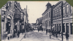
Yz. Anonazpocza Alexandristrasa