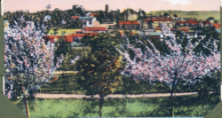
Blaumont (Szász. Vég.)