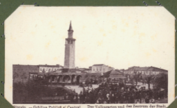
Orenburg. — Goldenes Publikum & Central. Der Volksgarten und das Zentrum der Stadt.