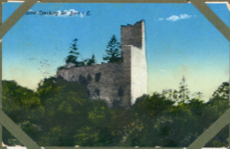
Alte Speyerburg bei Birt t. E.