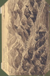
Mittellicher Rheingau bei Koblenz - Mosel - u. Scharzhof