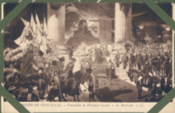
VERSAILLES. — Funerailles du Président Carnot. — G. Bérthod. — L.L.