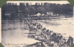
Die Holzbrücke über den Mejer in Kiewa.