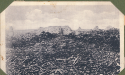
Überreste der Lutzerath