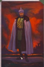
Kaiser Wilhelm II.