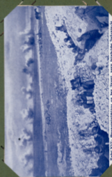
Zahl XVI. Orenburgstraße an der Grenze, vom Krasnojarsk-Bahnhof.