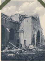
Kirche von Fournes. (Nordbrabant)