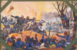
Devez — Grenif' Merthid Devez — Boods Munt.