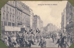
Einzug der Deutschen in Brüssel