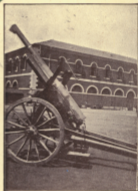
Gruß aus Nordfrankreich 1915.