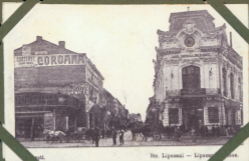
Ste. Lipsoni — Lipsoni