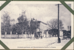
Hindenburgstrasse mit Gouvernements-Kasino in Kassel