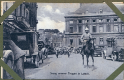
Einzug unserer Truppe in Lüttich.