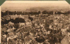
402. Blick von Turm der Kathedrale aus gesehen