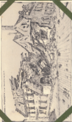
BRUGES en BELGIQUE. V. de la Belgique, no. 127.