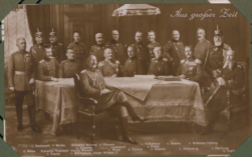
Aus großer Zeit