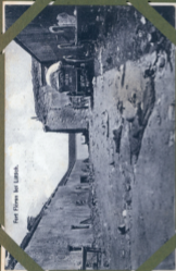
Fest Fliesen bei Lüttich.