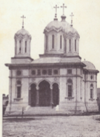
Iași. Catedrala St. Ignace.