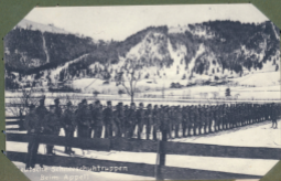
Alte Schweizertruppen Beim Appell