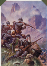
Für unser Land Tirol