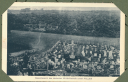
Quantité des croix des soldats allemands tués