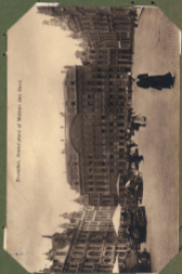
Brussels, Grand'place et Minster des Doms.