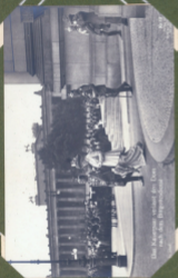
Die Kaiserin besucht den Deutscher Reichstag nach dem Bürgerkrieg.

Eine schmerzliche Art wurde über Deutschland herabgeschicket. Jeder dieser erregten aus zu großer Verwirrung. Man sucht und die Schwere in die Hand, ich helfe dir, wenn es nicht in letzter Stunde, meine Befehle pflegt, die Dagegen sein. Einmal zu bringen und den Frieden zu erhalten, wir die Schwere mit Gottes Hilfe zu überwinden, soll wir es mit einer wieder in die Schicksal dieses Mannes. Einmal Opfer an Blut und Blut würde ein Krieg sein. Einmal rück arbeiten. Der Dagegen aber werden wir zeigen, was es heißt, Deutschland auszufragen. Und nur erhebe ich Euch Gott dabei geht in die Hände, nicht wieder vor Euch und nicht für ein Hilfe für unser lieben Vaterland!