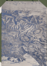
Höhenkarte der Kärntner Alpen an der italienischen Grenze