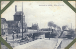
Usines de L.A. BASSER, - Ecluse de Coligny