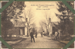
Ordnung vom Truppen-Übungsplatz Lager Lechfeld Militärische Lagerstrassen