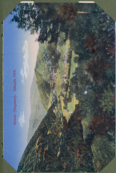
Urtis (Vogesen), Klärpfis 1914.