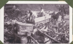
Metallumhandel am Behälter in Assis