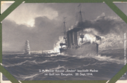
3. P. Wiener Kreuzer „Emden“ beschließt Madras im Golf von Bengalen, 22. Sept. 1914.