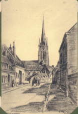
Beaucamps (Nord) Rue de l'Eglise.