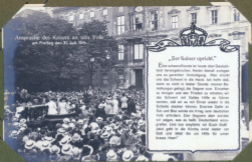
Ansprache des Kaisers an viele Tausende am Freitag den 21. Juli 1914.