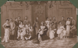
Das deutsche ...