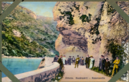
Akansa, Kazlıçifti — Karsınparlı