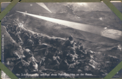
Im Schützengraben während eines Nachschlages an der Aisne.