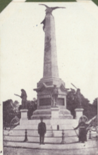
Iași. Monumentul Independenței. (Independence)